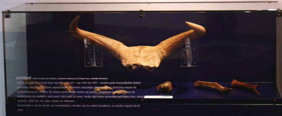
Schedel van een oer-os, gevonden bij de opgraving in het midden van de jaren '90 aan de Hoge Vaart – A27 te Almere, nu te zien in het Nieuw Land Erfgoedcentrum.