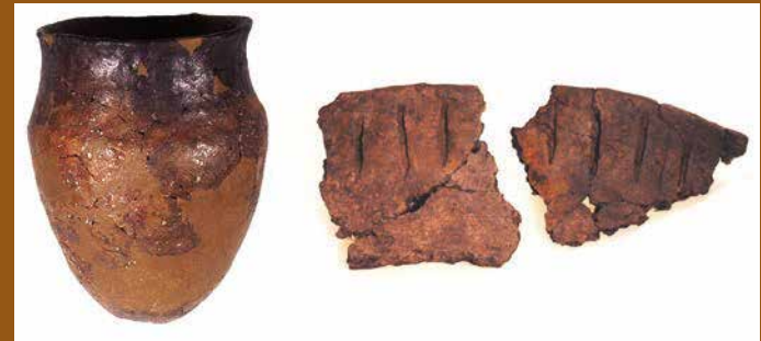
Voorbeelden van Swifterbant aardewerk: de pot links is afkomstig van Urk, de scherven van kavel E170.