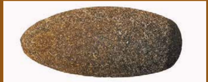
Een stenen bijl, gevonden in de omgeving van Swifterbant.