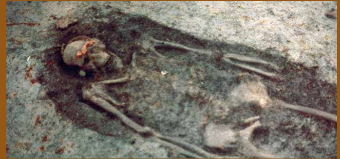
De 'Swifterbantman', gevonden tijdens de opgraving in de jaren '70 bij vindplaats S2 (Visvijverweg, Swifterbant).

Zoals het landschapsgebruik door de Swifterbant mensen: verbouwen zij zelf al granen of niet, en hoe en waar visten ze. Tevens wordt gekeken naar de eventuele achteruitgang van het archeologische bodemarchief zoveel jaren na de inpoldering. Zijn de archeologische resten nog in een goede conditie?