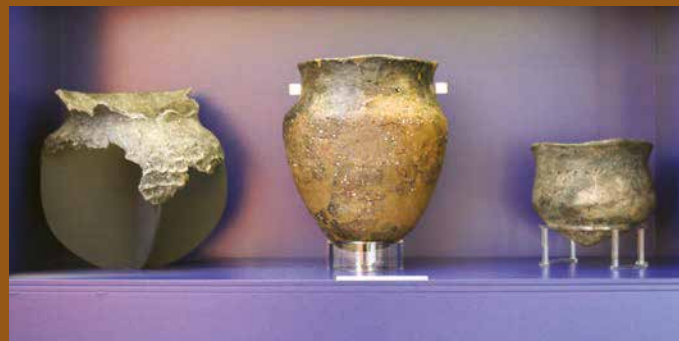
Swifterbant aardewerk in de tentoonstelling van het Nieuw Land Erfgoedcentrum.