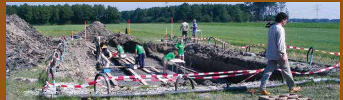
De opgraving in 2006 bij vindplaats S4 (Vuursteenweg, Swifterbant)