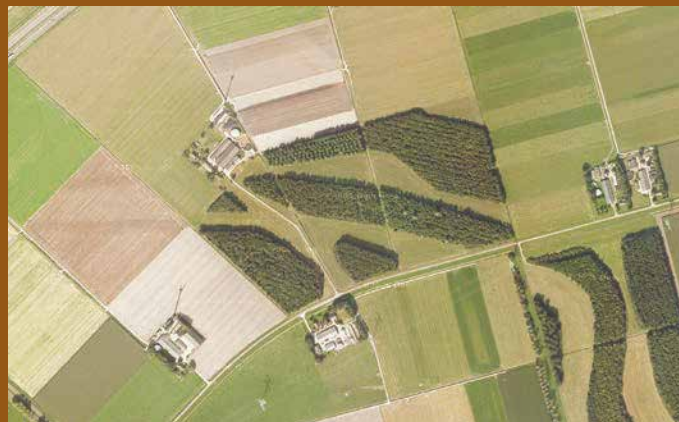
Inpassing van het archeologische terrein in het landschap bij vindplaats S2.

Voor kinderen is er bovendien de mogelijkheid om zelf op te graven en archeologisch onderzoek te doen in de attractie 'ondergronds'. Meer informatie kunt u vinden op de website www.nieuwlanderfgoed.nl .